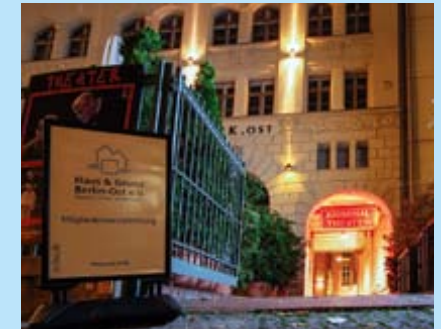
Ungewohnter Anblick unseres gewohnten Versammlungsortes: alle Fenster sind dunkel, das Restaurant im Haus geschlossen