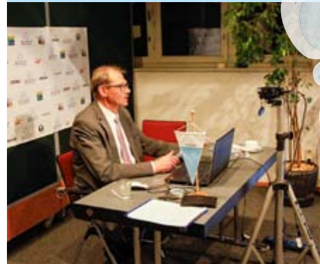
Blick in das Aufnahmestudio für das Referat von Herr Habeck – alles live!