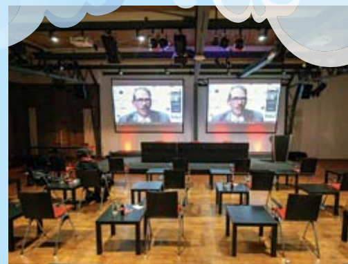
... obwohl wir auf „Andrang“ vorbereitet waren.